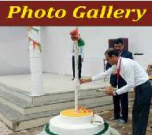
15th August Flag Hoisting