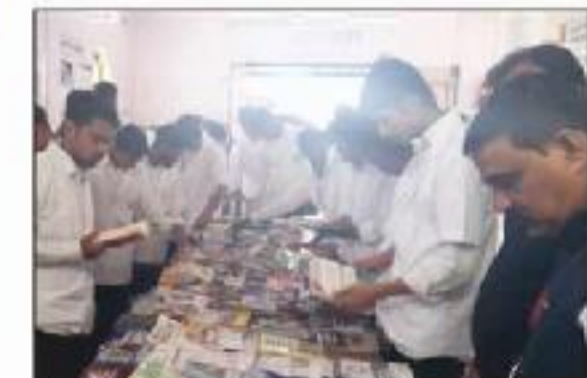
Vachan Prerna Diwas