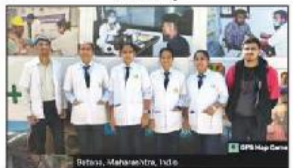
On Job Training (OJT) for M.Sc. I