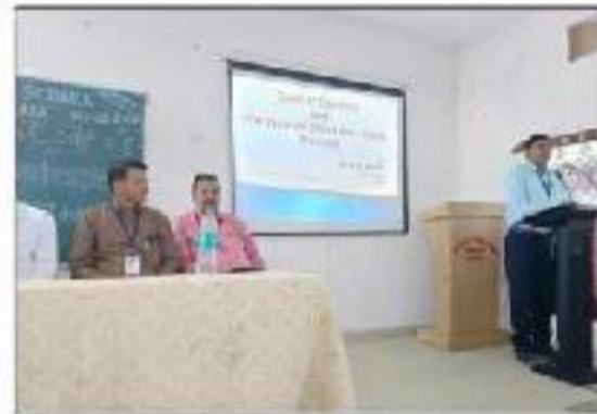
Code of Conduct