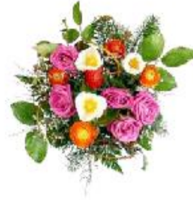
LATE SHRI SHANKARLAL AGRAWAL