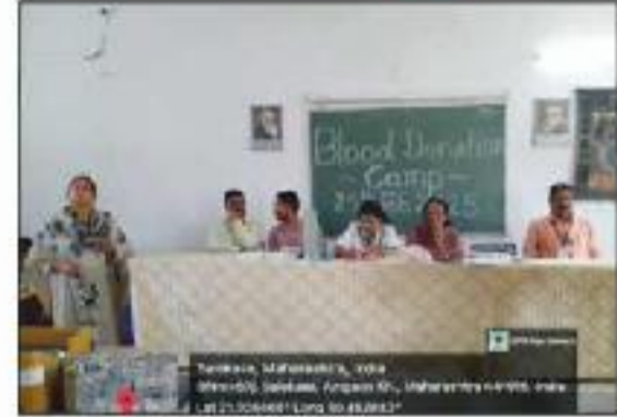
Blood Donation Camp