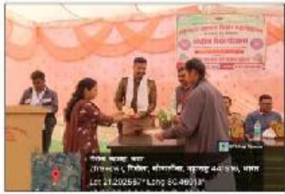
Cyber Security Under NSS