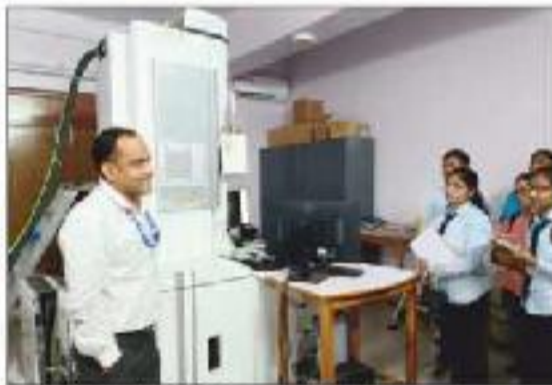
M.Sc. Study Tour at Bhubhneswar