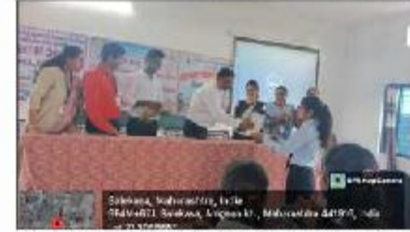
Chemical & Zoological Society Inauguration