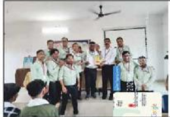
Best Non-Teaching Staff Felicitation