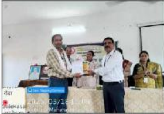
Best Teaching Staff Felicitation