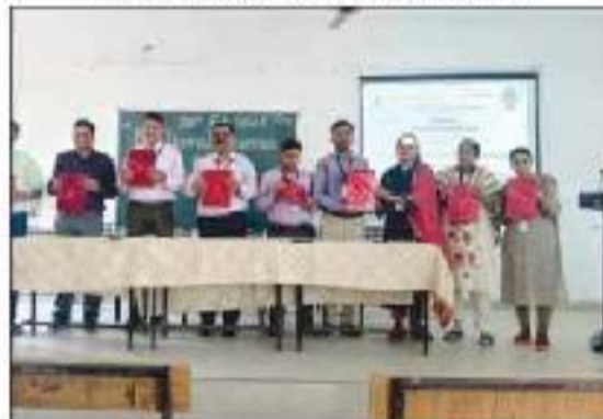
Edited Book Publication by Faculty