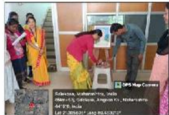
Netaji Subhashchandra Bose Jayanti