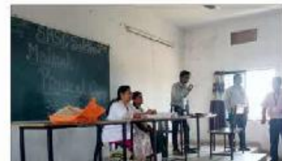
Medical Check-up Camp