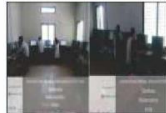
Computer Science Laboratory