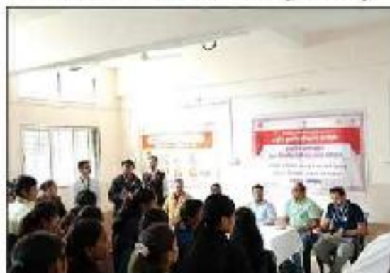
TB 100 Days Campaign