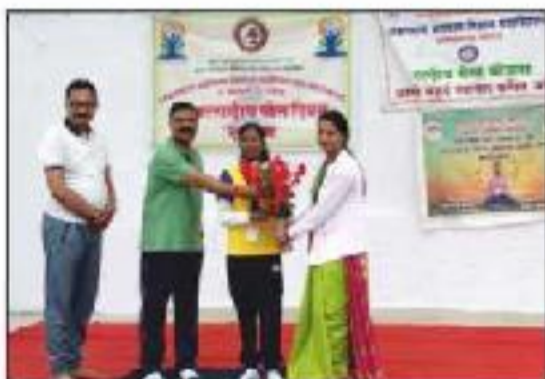
Yoga Day Celebration