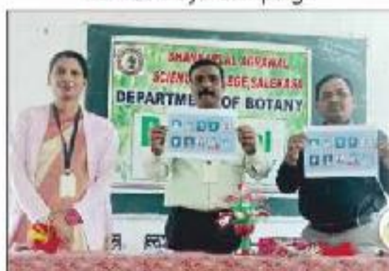
Inauguration of Botanical Society