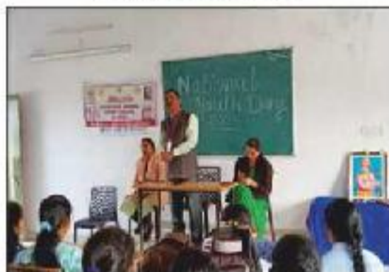
National Youth Day