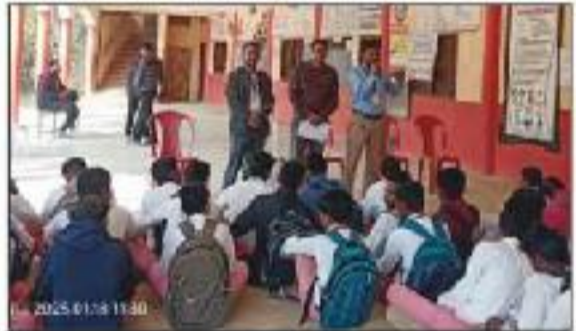
School Connect Activity