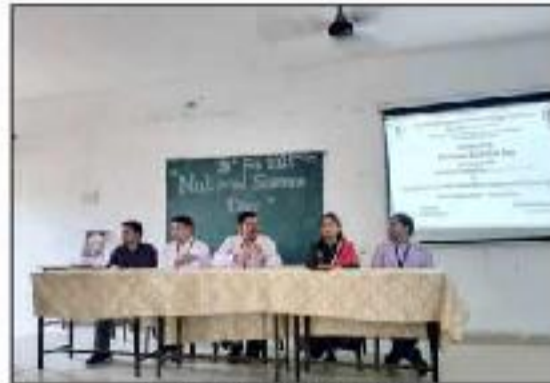
National Science Day