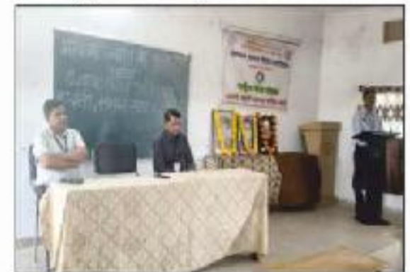
Bharatratna Dr. Babasaheb Ambedkar Jayanti