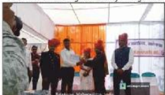
Student Receiving Award from Tahsildar Salekasa