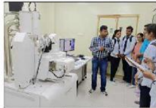
M.Sc. Study Tour CSIR-MMIT