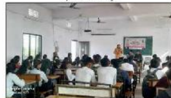
Group Reading Activity