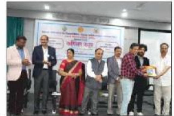
Mr. Dongapure receiving Award from Career Katta