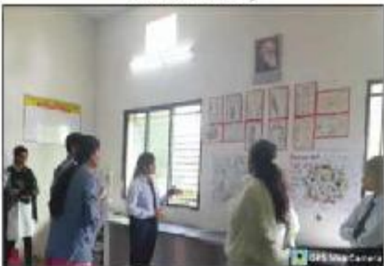
Wild Life Day Poster Presentation