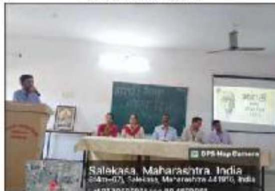
Marathi Bhasha Day