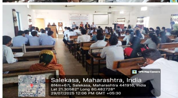
Salekasa, Maharashtra, India 8f4m+67j, Salekasa, Maharashtra 441916, India Lat 21.30562° Long 80.482728° 29/07/2025 12:06 PM GMT +05:30