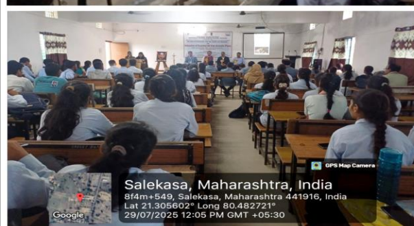
Salekasa, Maharashtra, India 8f4m+549, Salekasa, Maharashtra 441916, India Lat 21.305602° Long 80.482721° 29/07/2025 12:05 PM GMT +05:30