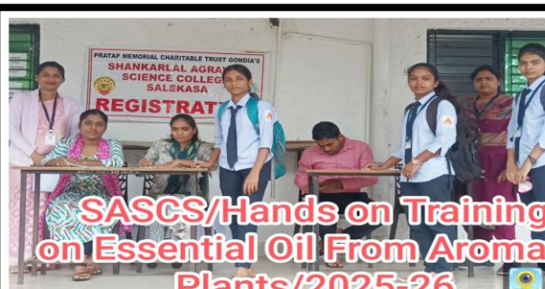
SACS/Hands on Training on Essential Oil From Aromatic Plants/2025-26