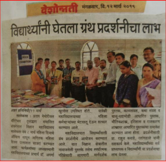
शुभसेल उपस्थित होते. यावेळी महाविद्यालयाच्या महिला कर्मचाऱ्यांच्या भेटवस्तू देऊन सत्कार करण्यात आले. महाविद्यालयात विद्यार्थ्यांसाठी ग्रंथ प्रदर्शनीचे आयोजन करण्यात आले. यात विज्ञान क्षेत्रातील नावाजलेली पुस्तके तसेच स्पर्धात्मक परिक्षेसाठी त्यागपत्री मार्गदर्शक पुस्तक, काव्यसंग्रह, कथा संग्रह व चालू-पहाडामोडी आधारित पुस्तक, मौखिकशास्त्र, इतिहास व राजकारण याबाबत आधारित पुस्तकांच्या समवेत करण्यात आला होता. प्रदर्शनीसाठी प्रा. राहुल कवाडे, राहगडाले यांनी सहकार्य केले. महाविद्यालयाच्या सर्व प्राध्यापक व विद्यार्थ्यांनी या प्रदर्शनीचा लाभ घेतला.